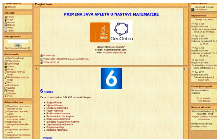
Slika 2: Kurs razvijen u sistemu za e-učenje

Konkretno, dobar predlog za unapređenje nastave mogu biti virtualne učionice koje se u osnovi mogu definisati kao skup tehnologija, strategija za učenje, prezentacija i raznih aktivnosti za učenje kojima se podstiče i promovise interakcija u realnom vremenu između grupe korisnika i nastavnika. Bitno je naglasiti da virtualne učionice mogu biti formirane kao skup apleta (interaktivnih simulacija, sadržaja) koji pružaju adekvatnu korisničku podršku učenicima u učenju.