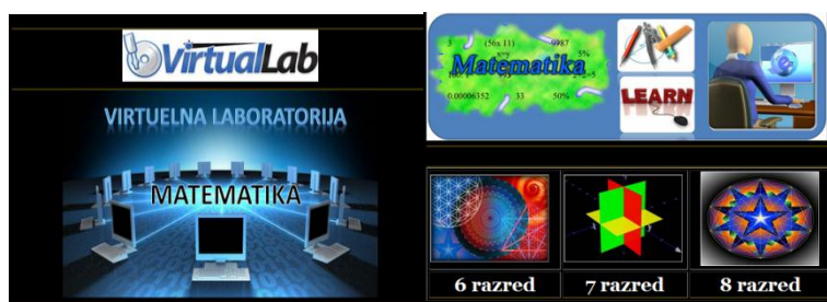
Slika 3: Virtualna laboratorija namenjena talentovanim učenicima VI, VII i VIII razreda za predmet matematika

Za potrebe nastave matematike autor ovog rada je odradio web stranu [ http://muzafers.uninp.edu.rs/virtualLAB.html ], postupak i način izrade ove strane je opisan u radu (Saračević i Mašović, 2010)] u vidu virtualne laboratorije sa mnoštvom apleta koji se direktno odnose na zadatke koji su rađeni u toku školskog časa.